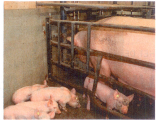
De pasgeboren biggen krijgen via de moedermelk extra laurinezuur, doordat de zeug dit extra vreet.

Als gespeende biggen extra laurinezuur en monolauraat krijgen, neemt de weerstand tegen een streptokokken-besmetting toe en zijn er minder antibiotica nodig. Zeugenmelk bevat van nature laurinezuur voor extra weerstand tegen bacteriën en virussen. Door in zeugvoer extra laurinezuur in de vorm van Daafit Plus te mengen, drinken de biggen meer laurinezuur via de melk. Dat verkleint de kans op vroege clostridium-infecties.