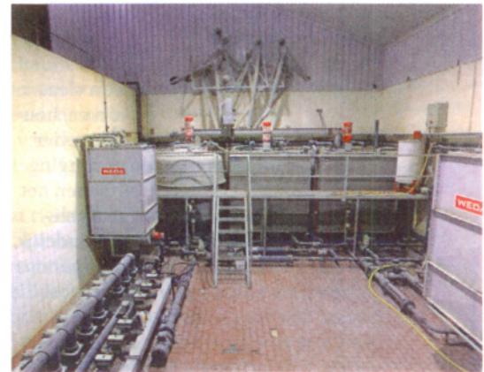
Het mengsel van laurinezuur en monolauraat kan in mengvoer en in brijvoer worden gebruikt. Het werkt goed tegen grampositieve bacteriën als clostridium.