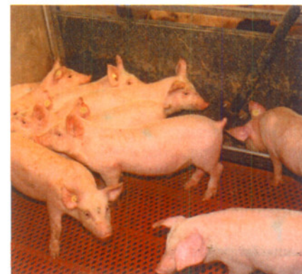
Problemen met streptokokken bij gespeende biggen zijn verminderd na het toedienen van laurinezuur en monolauraat in het voer.