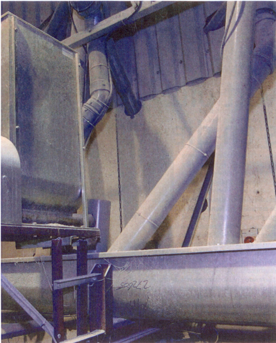
De varkenshouder kan Daafit Plus via een droogvoerdosator in de juiste hoeveelheid aan het brijvoer toevoegen.

jeshof: „We zijn al langer op zoek naar toevoegingen, onder meer speciaal veevoer, die het antibioticagebruik omlaag brengen. Daarvoor is kokosolie gebruikt, maar dat werkt niet afdoende. Laurinezuur uit kokosolie met monolauraat werkt goed tegen streptokokken. Dit hebben we in ons lab aangetoond én op die 30 bedrijven.” Daar is na het gebruik het preventieve antibioticagebruik tot 40 procent gedaald. „Een voorwaarde is wel dat de gezondheid op het bedrijf goed is”, vervolgt De Snoeck. „Varkenshouders verwarmen streptokokken wel eens met de ziekte van Glässer, PRSS of Circo, waartegen het mengsel van laurinezuur en monolauraat niet helpt.” Op dit moment gebruiken 50 tot 60 bedrijven het mengsel van laurinezuur en monolauraat, veelal geleverd door mengvoerleveranciers.